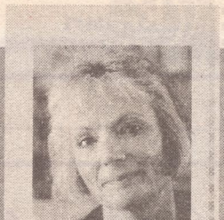
Redactie Geertje Bos

toen artsbezoeker geworden bij het farmaceutische concern van Bayern. Later productmanager. Op die manier kon ik de mensen meer persoonlijk benaderen.”